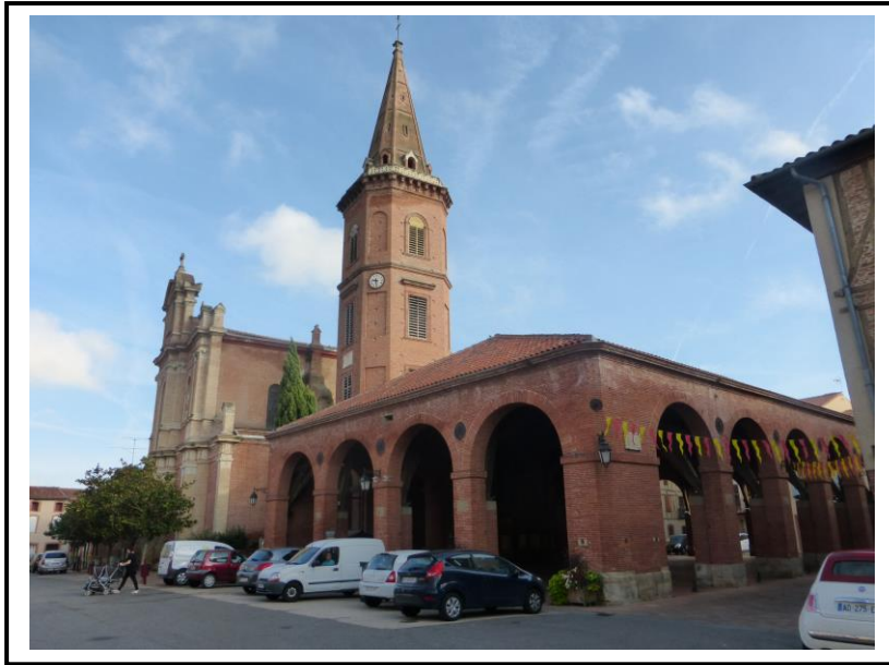
Le bel ensemble de brique rouge que forment la halle et l'église de Mazères...