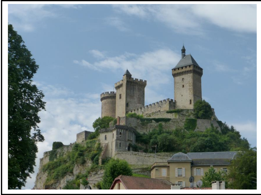
Dressé sur son poq au cœur de la cité, le majestueux château comtal de Foix...