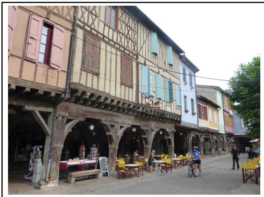
Mirepoix, les couverts colorés et la célèbre Maison des Consuls...

Le blason de la ville fut établi plus tardivement, au début du XIX e siècle : « D'azur, à un poisson (truite) d'argent, posé en fasce, et un chef cousu de gueules, chargé de trois étoiles d'or » ; il serait basé sur cette étymologie fautive.