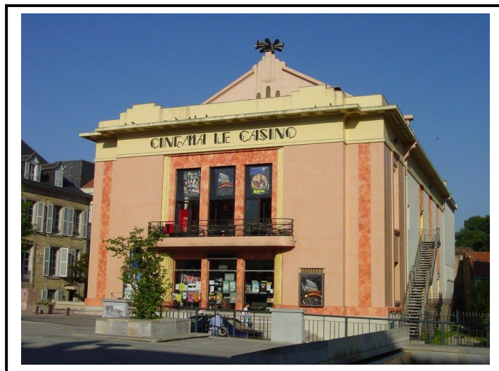
L'emblématique silhouette du vieux cinéma de Lavelanet...

Mercredi 17 septembre : Lavelanet – Foix – Saint-Jean de Falga – La Tour du Criu - Gardouch 84 kilomètres – 5 h 30 de selle et 15,4 km/heure de moyenne environ